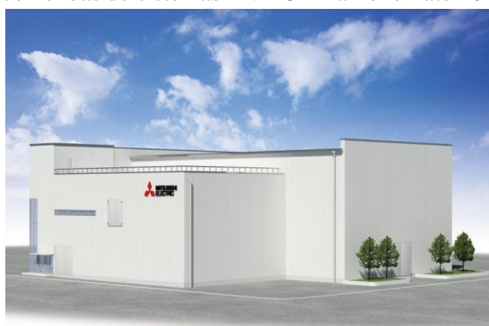
Apresentação das instalações de verificação de HVDC da Mitsubishi Electric

TÓQUIO, 12 de outubro de 2016 – A Mitsubishi Electric Corporation (TÓQUIO: 6503) anunciou hoje que irá entrar no mercado global de sistemas de corrente contínua de alta tensão (HVDC) com base em conversores de tensão (VSC) com a construção das novas instalações de verificação de HVDC no seu Transmission and Distribution Center em Amagasaki, Japão, até 2018. A empresa tem como objetivo mais de 500 milhões de dólares em encomendas de sistemas HVDC -Diamond ® até 2020.