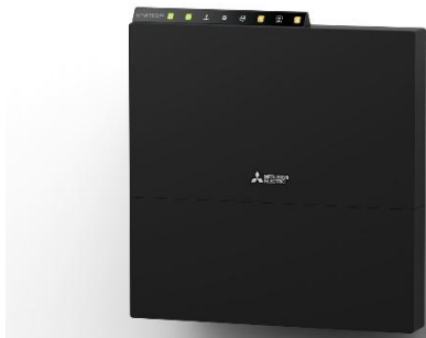
Ilustração 1: instalação de montagem em parede