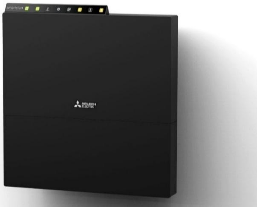
Gateway de comunicação Mitsubishi Communication Gateway XS-5R/XS-5T resistente ao ambiente

A Mitsubishi Communication Gateway XS-5R/XS-5T é um dispositivo de gateway para monitorização remota, previsão de avarias, gestão integrada de várias instalações e outras soluções da IoT. Além das aplicações em fábricas e edifícios, é utilizada em funções de segurança de infraestruturas, tais como a monitorização remota dos níveis do mar e de rios e a previsão de avarias em equipamentos e instalações de geração de energia solar e eólica.