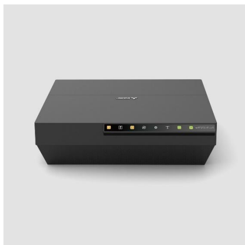
Ilustração 3: montagem horizontal num bastidor