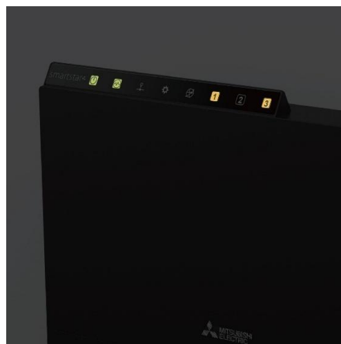
Ilustração 4: ecrã de pictograma com retroiluminação