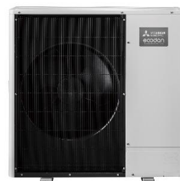
Série Ecodan PUHZ-AA de unidades de bomba de calor ar-água para exterior