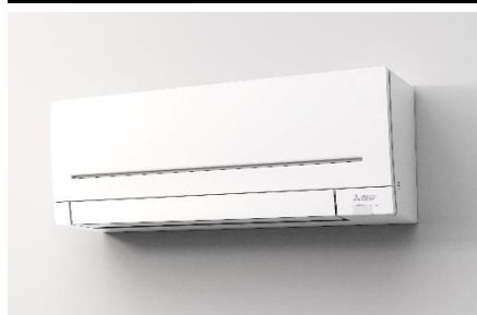
Série MSZ-AP de aparelhos de ar condicionado para divisões