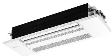
Séries MLZ-KP/MLZ-RX/MLZ-GX/MLZ-HX de aparelhos de ar condicionado unidireccionais de cassette e montagem em teto