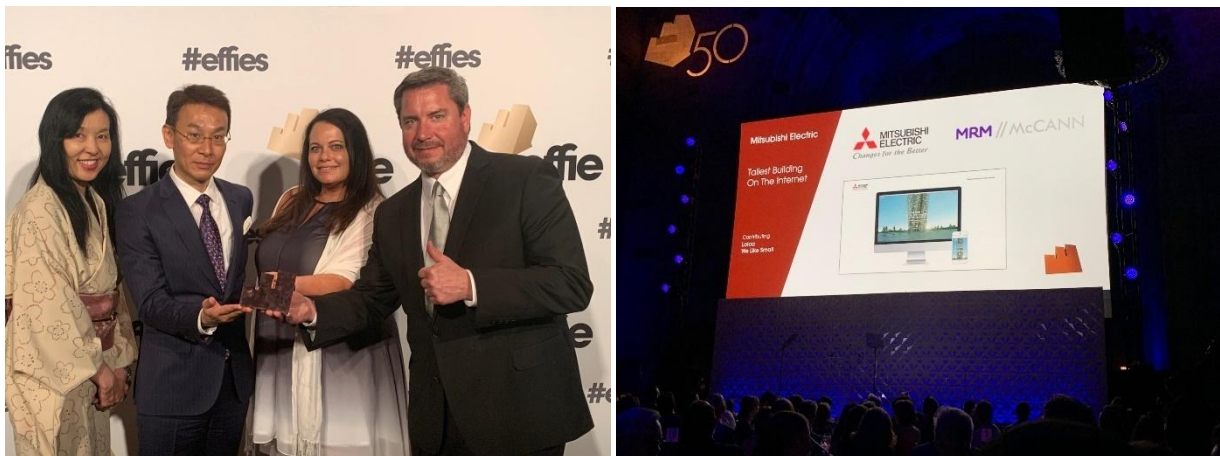
Cerimónia dos Prémios Effie (hora local a 30 de maio de 2019 em Nova Iorque, Gala Effie nos EUA)

TÓQUIO, 3 de junho de 2019 – A Mitsubishi Electric Corporation (TÓQUIO: 6503) anunciou hoje que o website Building Solutions da Mitsubishi Electric US, Inc. recebeu o prémio Bronze na categoria "de empresas para empresas" (B2B) dos Prémios Effie, um programa de prémios internacionais que reconhece a excelência na área da publicidade. A Mitsubishi Electric é o único vencedor da categoria B2B este ano, acreditando-se ser a primeira vez que um fabricante de dispositivos eletrônicos japonês tenha arrecadado um prémio Effie nesta categoria.