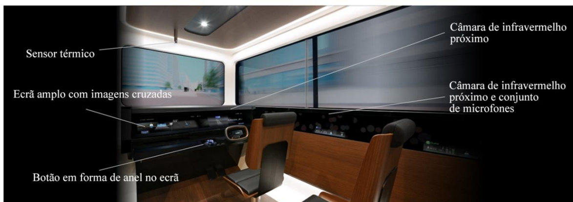
Representação do EMIRAI S

TÓQUIO, 8 de outubro de 2019 – A Mitsubishi Electric Corporation (TÓQUIO: 6503) revelou hoje o seu concept car EMIRAI S equipado com tecnologias de ponta, tais como uma inovadora interface homem-máquina e tecnologias de deteção biológica, que deverão contribuir para um transporte seguro, bem como uma comunicação melhorada dos passageiros na futura sociedade de mobilidade como um serviço (MaaS). O EMIRAI S estará em exposição durante a 46.ª edição do Tokyo Motor Show de 2019, no complexo de exposições Tokyo Big Sight em Tóquio, Japão, de 24 de outubro a 4 de novembro.